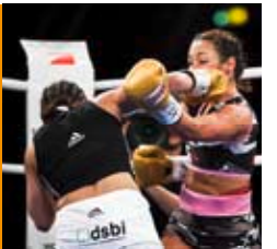
Susianna Kentikian, dreifache Box-Weltmeisterin

Sie möchten den VCT Sport® selbst anwenden und in ihre Trainingsarbeit integrieren? Wir bieten Ihnen verschiedene praxisnahe Seminare an: